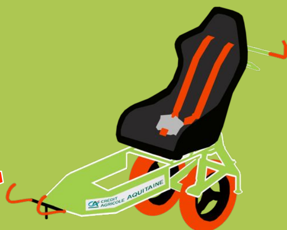
VERSION COURSE À PIED

La Roue Tourne 40 a officiellement reçu et présenté les deux Myolibs qui permettront à Elodie, Magalie et bien d'autres de parcourir des kilomètres de bitume et de sentier.